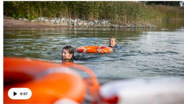
Naantalien Velkuan koululla opetellaan vedestä pelastautumista. Video: Arttu Kuivainen / Yle

Suomen uimaopetus- ja hengenpelastusliitto jakaa uudet uimaopetusohjeet kouluihin syyskuun aikana. Ensimmäiset vesipelastustaitoja korostavat opetusmenetelmät ovat jo käytössä.